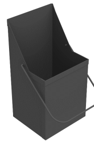
Ведро для удобной загрузки угля