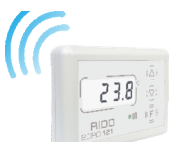
Комнатный беспроводной термостат Komfort 121