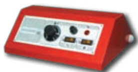
Пульт управления котла при работе с горелкой (опция)

Стальной водогрейный котел центрального отпления ЕКО-СК мощностью от 20 до 110 kW работающий на твердом топливе (дрова, уголь). При снятии заглушки нижней двери и установке пульта управления котел может работать с наддувной горелкой на солярке, газе, или на пеллетах. Котел имеет лабиринтную конструкцию (топочная камера + 3 горизонтальных хода), позволяющую максимально использовать теплоту продуктов сгорания. При изготовлении котла применены качественные материалы и современные методы производства. Котел отвечает требованиям Европейских Норм EN 303-5.